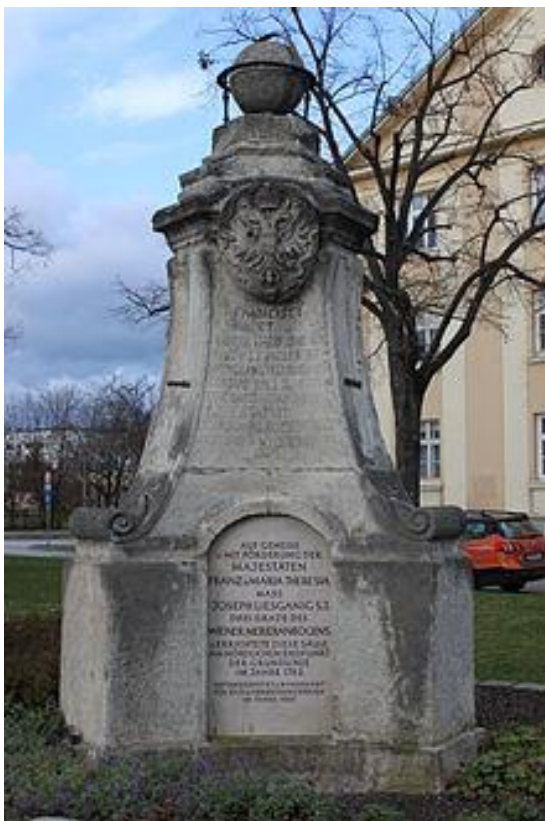
Denkmal (Liesganigstein nach einem Entwurf von Fürst Kaunitz) am Wiener Neustädter Endpunkt der Basismessung 1765.

1985 durfte ich meine Mutter zur Feier ihres goldenen Ingenieurdiploms begleiten: Sie hat sich damals stolz ihrer Erfolge erinnert, sah sich aber nie als „Karrierefrau“. Im Gegenteil: in der Erinnerung waren die Verletzungen der frauenfeindlichen Erlebnisse sehr schmerzhaft und sie hat uns Töchtern alles andere als Mut gemacht. Dennoch war sie uns ein Vorbild an Gewissenhaftigkeit und Arbeitstreue: Oft dachte ich in meinen Jahren als Beruf und Kindererziehung schier unvereinbar schienen: „Sie hat es noch viel schwerer gehabt“!